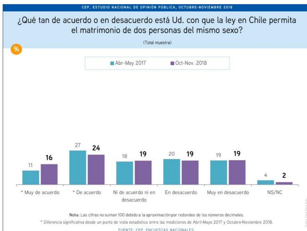
Gráfico N°3: Estudio Nacional de Opinión Pública, octubre-noviembre 2018. Centro de Estudios Públicos.

Una de las encuestas más conservadoras en materia de apoyo al matrimonio igualitario ha sido la Encuesta CEP. Sin embargo, en su Estudio Nacional de Opinión Pública de octubre-noviembre del año 2018 (Gráfico N°3), muestra por primera vez, tal como las encuestas anteriores, que existe una mayoría social en favor de la iniciativa del matrimonio igualitario, y que en Chile son más las personas que apoyan este proyecto que aquellas que lo rechazan. En esta última encuesta, se puede observar que un 40% de la ciudadanía está por permitir a todas las parejas casarse, mientras que un 38% lo rechaza. Asimismo, un 19% de la ciudadanía dice no estar de acuerdo ni en desacuerdo con la iniciativa. Finalmente, esta encuesta reafirma que cuando hablamos de matrimonio igualitario, el apoyo ciudadano tiende a crecer en el tiempo, y no a disminuir, consolidando la convicción de la sociedad chilena por tener una legislación que reconozca este vínculo para todas las parejas del país.